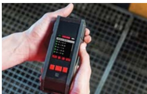
OKÓTOVANÝ VÝSLEDEK SENSOR