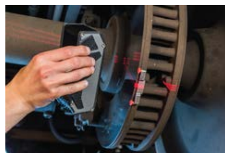
MĚŘENÍ BEZ MECHANICKÉ POMŮCKY