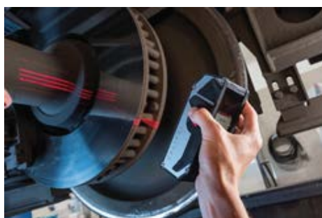
MĚŘENÍ BEZ MECHANICKÉ POMŮCKY