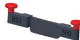
POMŮCKA PRO MĚŘENÍ “BS1-500”