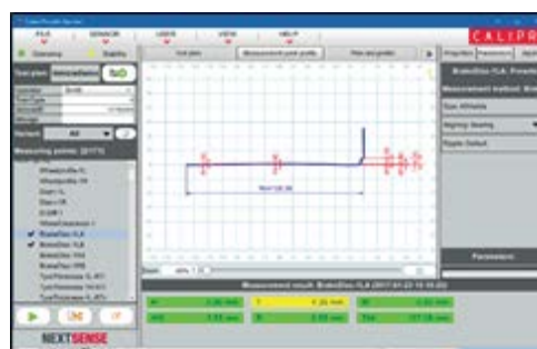
OKÓTOVANÝ VÝSLEDEK – TABLET PC